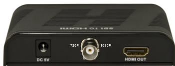
SDI TO HDMI主机